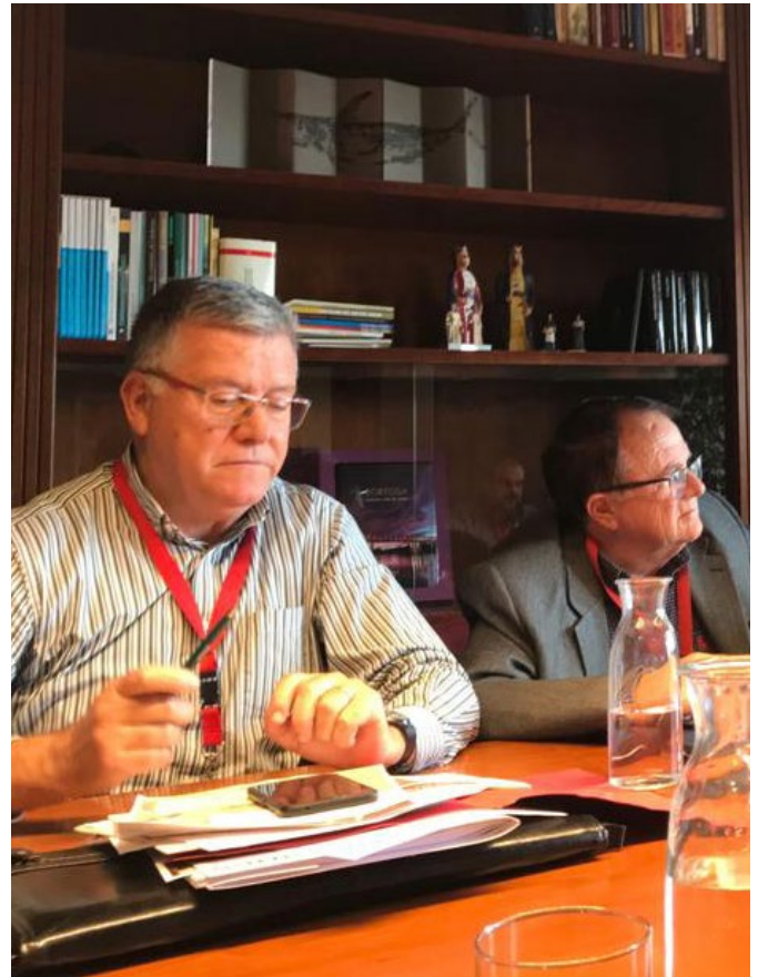
Tots els presidents de les Territorials van participar en la trobada.

Des de la Federació Catalana de Caça es volien tractar molts temes, alguns verdaderament urgents per al bon funcionament del sector cinegètic.