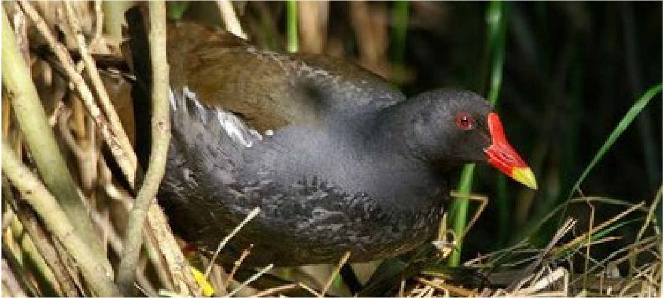
Els cens ha comptat amb la col·laboració de 115 persones

El cens del becadell comú ja s'ha iniciat, en el qual intervenen les Societats de Caçadors i els Cotos privats, on hi hauran unes 25 persones facilitant informació, i probablement, serà un cens curiós, degut a què hi hauran oscil·lacions respecte a les èpoques en que es manté l'aigua al Delta, ja que l'assecamment del Delta és un problema per a les aus.