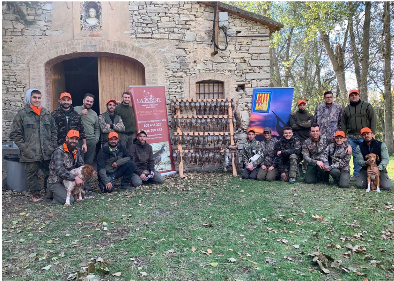
La Territorial de Lleida, organitzadora de la trobada, va comptar amb la col·laboració de les societats de caçadors d'Hostalets i Sant Antolí i de Cinegètica La Perdiu

El passat 9 de novembre la Federació de Caça de Lleida va organitzar una cacera de perdius roges al terme municipal de la Ribera d' Ondara. Aquesta activitat pretén potenciar la caça entre els joves. Hi van assistir 15 caçadors fins a 25 anys provinents de les 4 províncies de Catalunya.