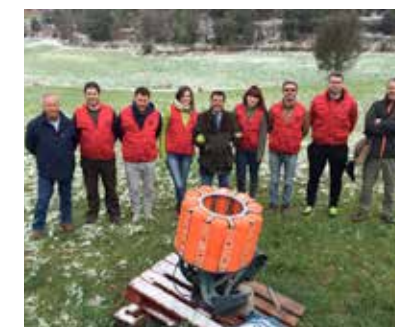
Curs de jutges de Compak Sporting i Recorreguts de Caça

El 25 de juny de 2017, en el marc de la IV Fira del Caçador de Sant Fruitós de Bages està previst celebrar un reconeixement de raça de podenc eivissenc. Aquesta és l'oportunitat de portar a reconèixer els vostres gossos!